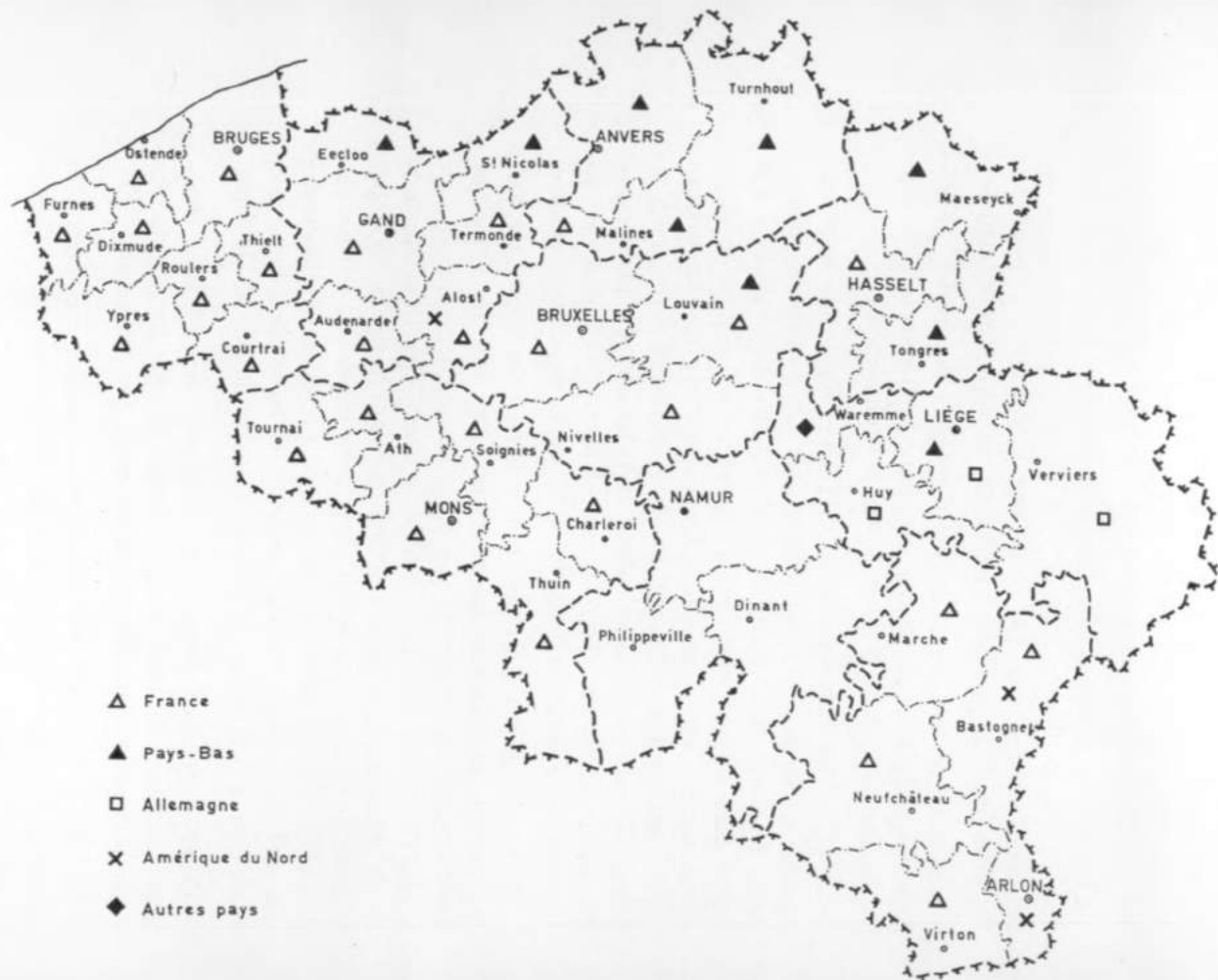
CARTE 2. — Destination des émigrants.